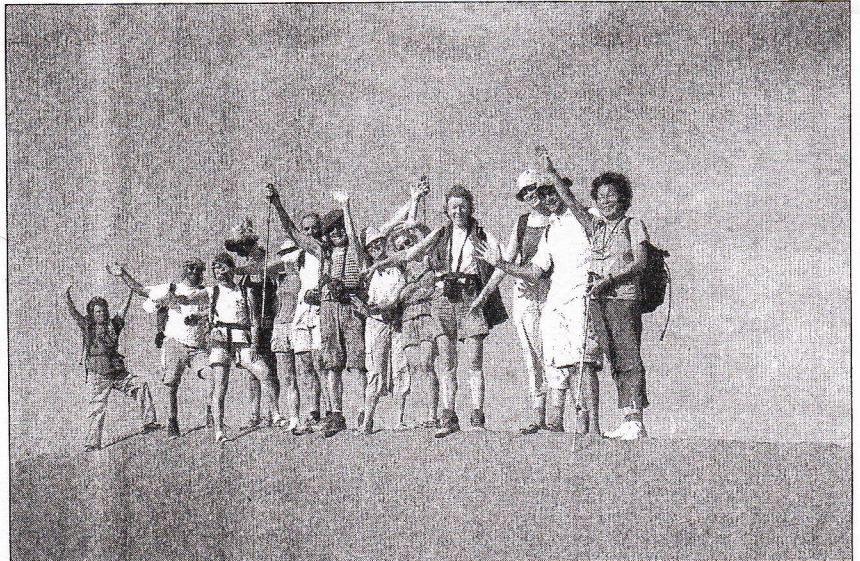
Au programme : randonnées à pied et promenades dans le désert...